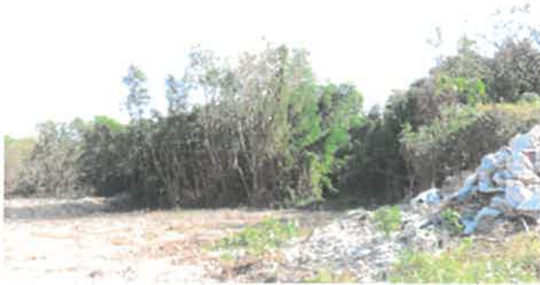
日期：113/01/15 說明：工區 1K+560 南側次生林