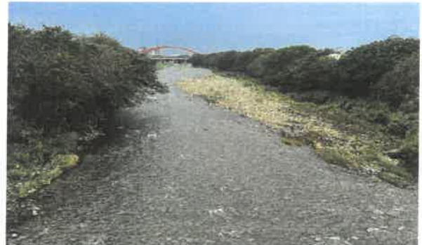
日期：115/03/31 說明：筏子溪工區上游濱溪帶