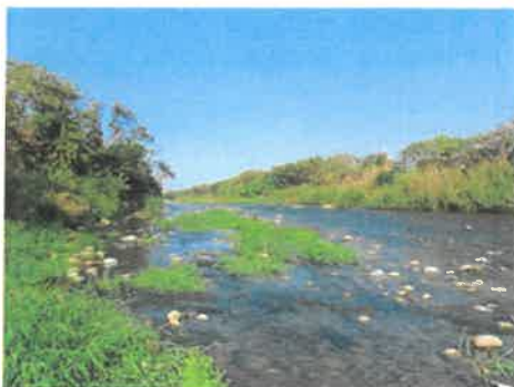
日期：113/01/15 說明：筏子溪工區上游濱溪帶