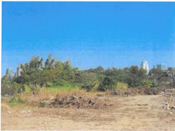
日期：113/01/15 說明：工區 1K+560 北側次生林