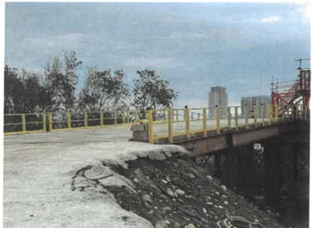
日期：115/03/31 說明：工區 1K+560 北側次生林警示線設置