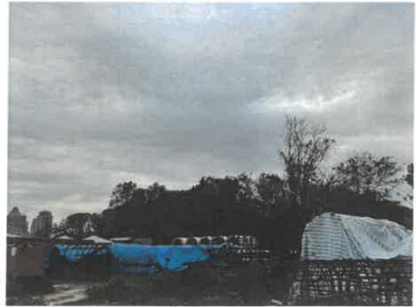
日期：115/03/31 說明：工區 1K+560 南側次生林警示線設置